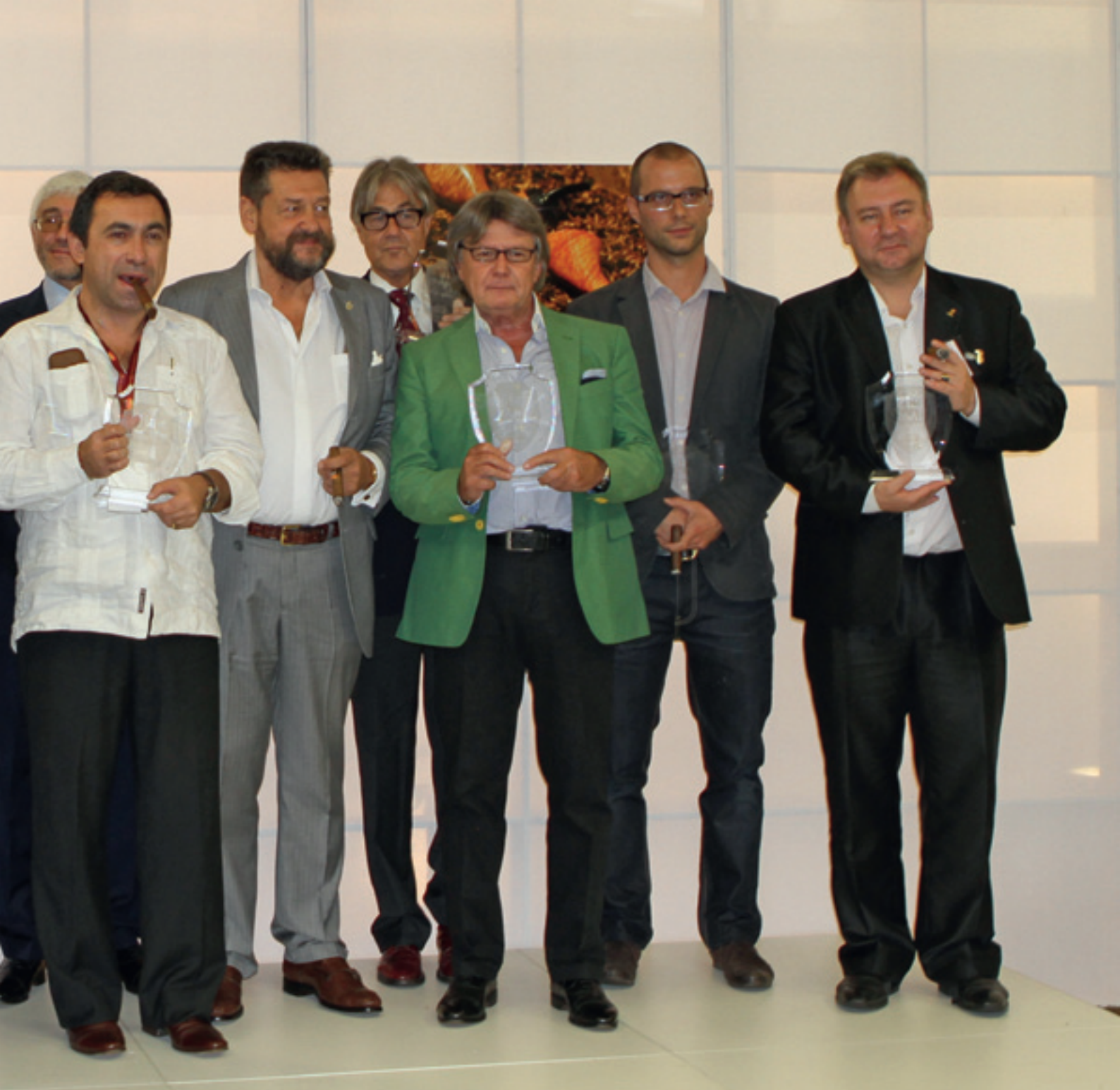
Honor of those who love their work.