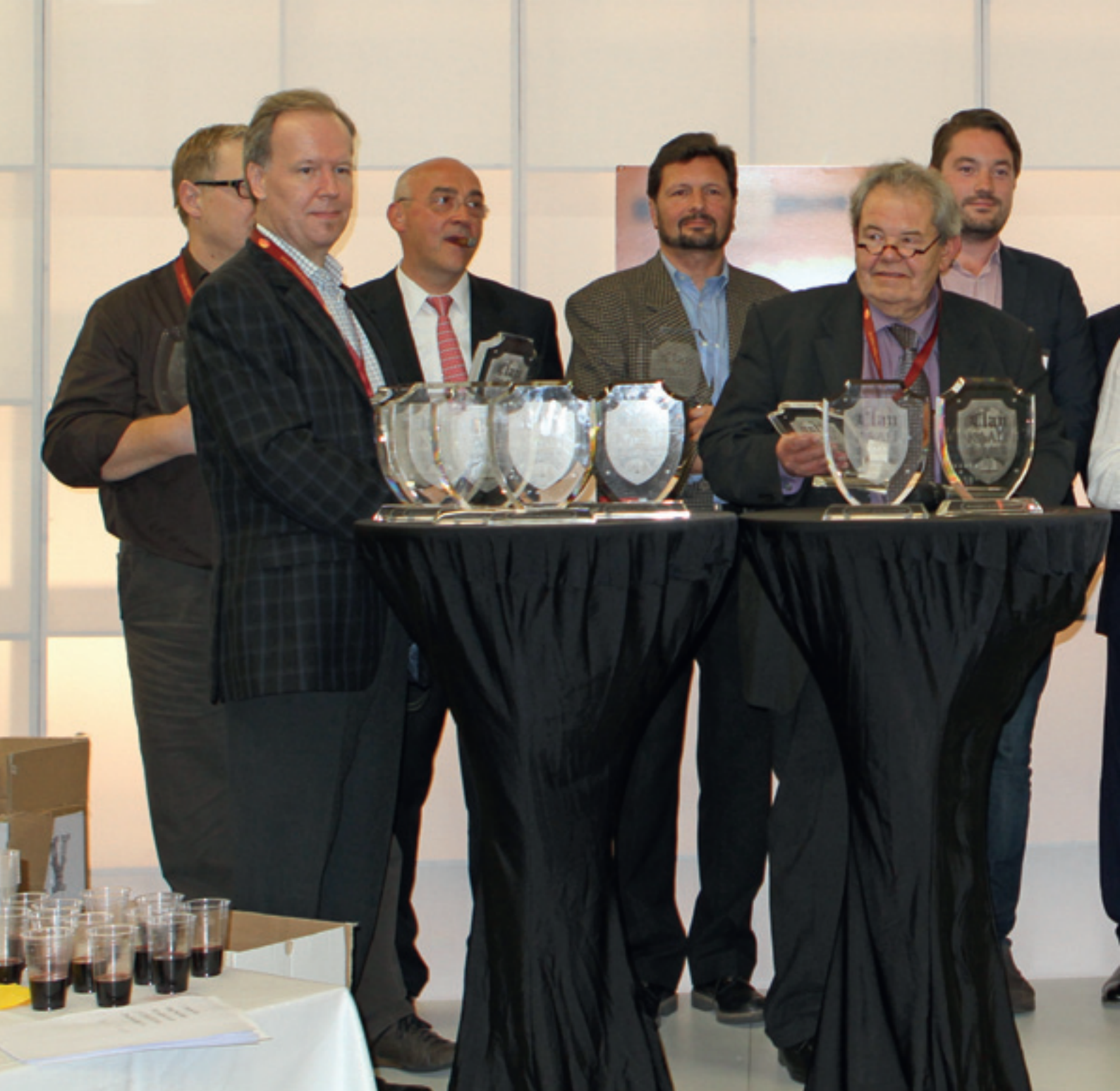
Ehrung derer, die ihre Arbeit lieben.