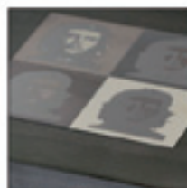
New Ed. in metal