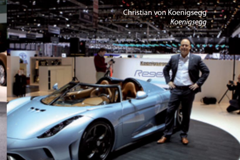
Christian von Koenigsegg Koenigsegg