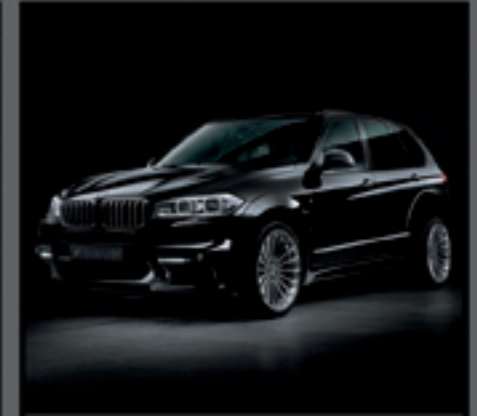
BMW X3 F13 HAMANN WIDEBODY