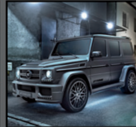
AMG G65 SPYRIDON