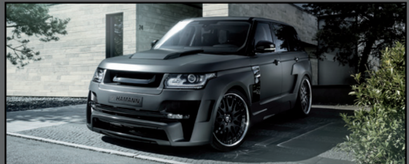
Range Rover Vogue MYSTÈRE

Individuelle Hochleistungsautomobile mit modernster Technik und faszinierendem Design sind die Spezialität von HAMANN MOTORSPORT.