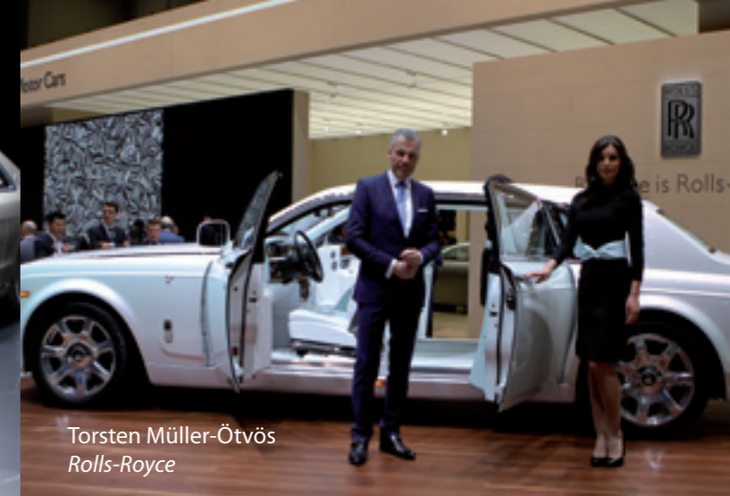
Torsten Müller-Ötvös Rolls-Royce