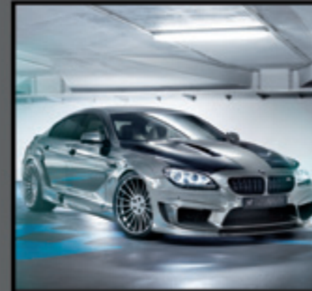
BMW M4 Gran Coupé MIRROR GC