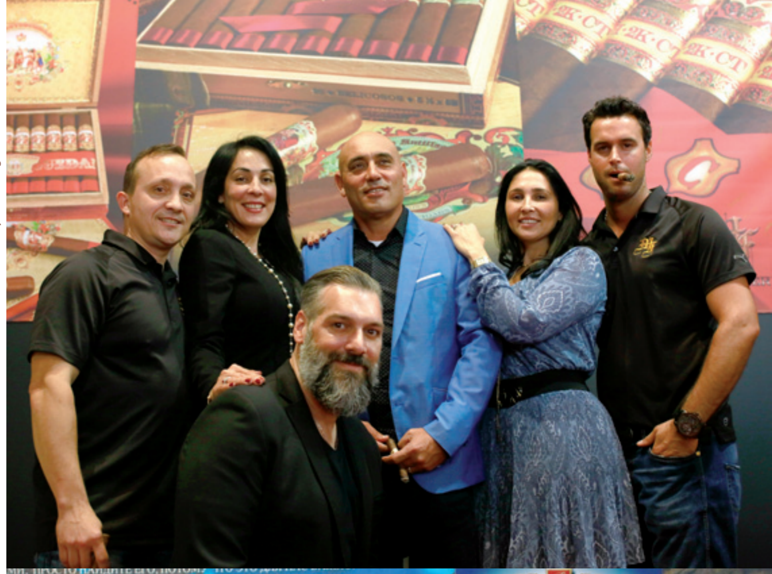
My Father Cigars Team, 4.B14